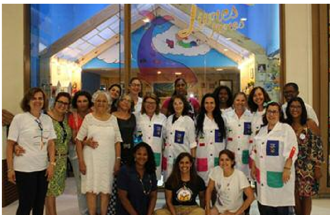
Encontro de Autores Baianos de Literatura Infantil.

Muitas informações foram compartilhadas, livros, apresentados, ideias a floraram e houve a certeza de que outros encontros acontecerão. O evento mostrou a importância de a Viva Bahia fazer-se presente para levantar a bandeira da contínua contribuição, divulgando e firmando parcerias com excelentes pessoas.