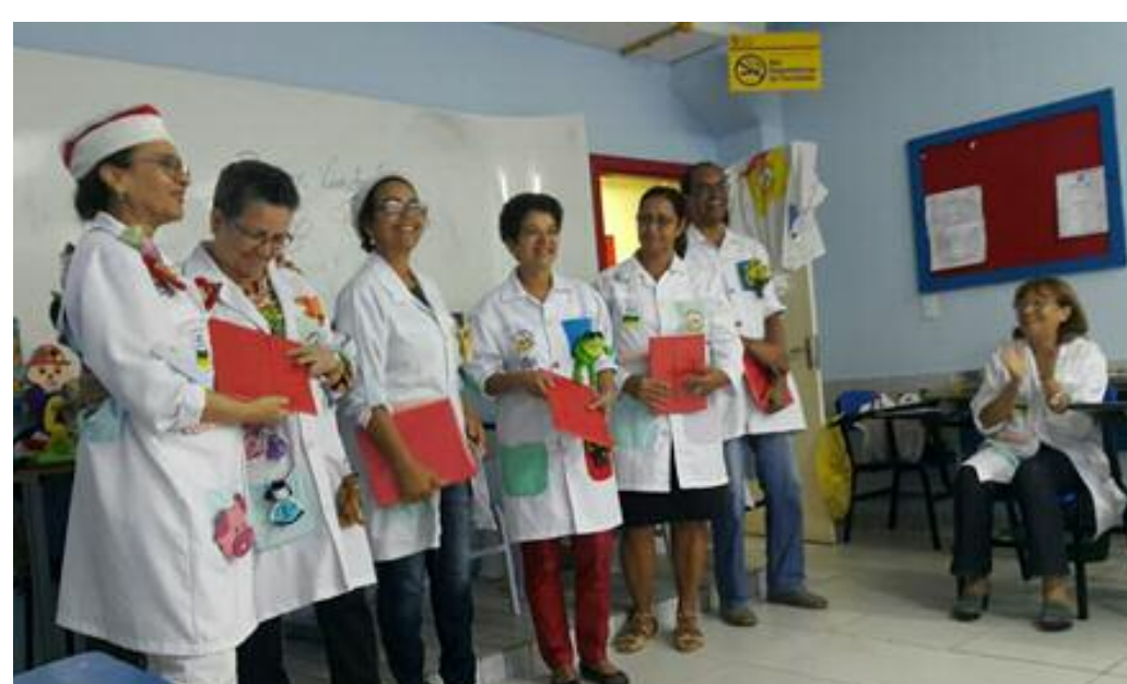
Voluntários homenageados (Estrelas 2016)