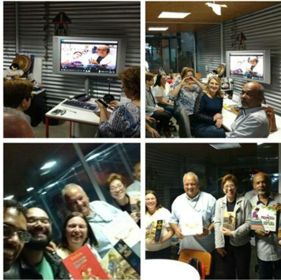
Encontro de voluntários.

Além de rever amigos de outros dias, assistir à entrevista feita com um dos atendidos na Santa Casa e conversar sobre o trabalho no hospital, houve contação de histórias e troca de livros em uma divertida brincadeira de amigo secreto.