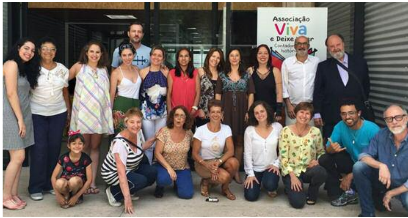
Foto oficial da confraternização de fim de ano na sede da Viva e Deixe Viver.

A festa de confraternização de funcionários, cabeças de chave e membros do conselho e da diretoria da Associação Viva e Deixe Viver aconteceu no dia 22 de dezembro de 2016, com muita alegria e união.